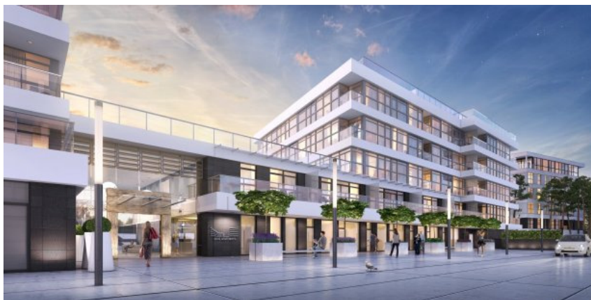
Tak ma wyglądać cały kompleks Dune Resort w 2017 r (materiały Firmus)