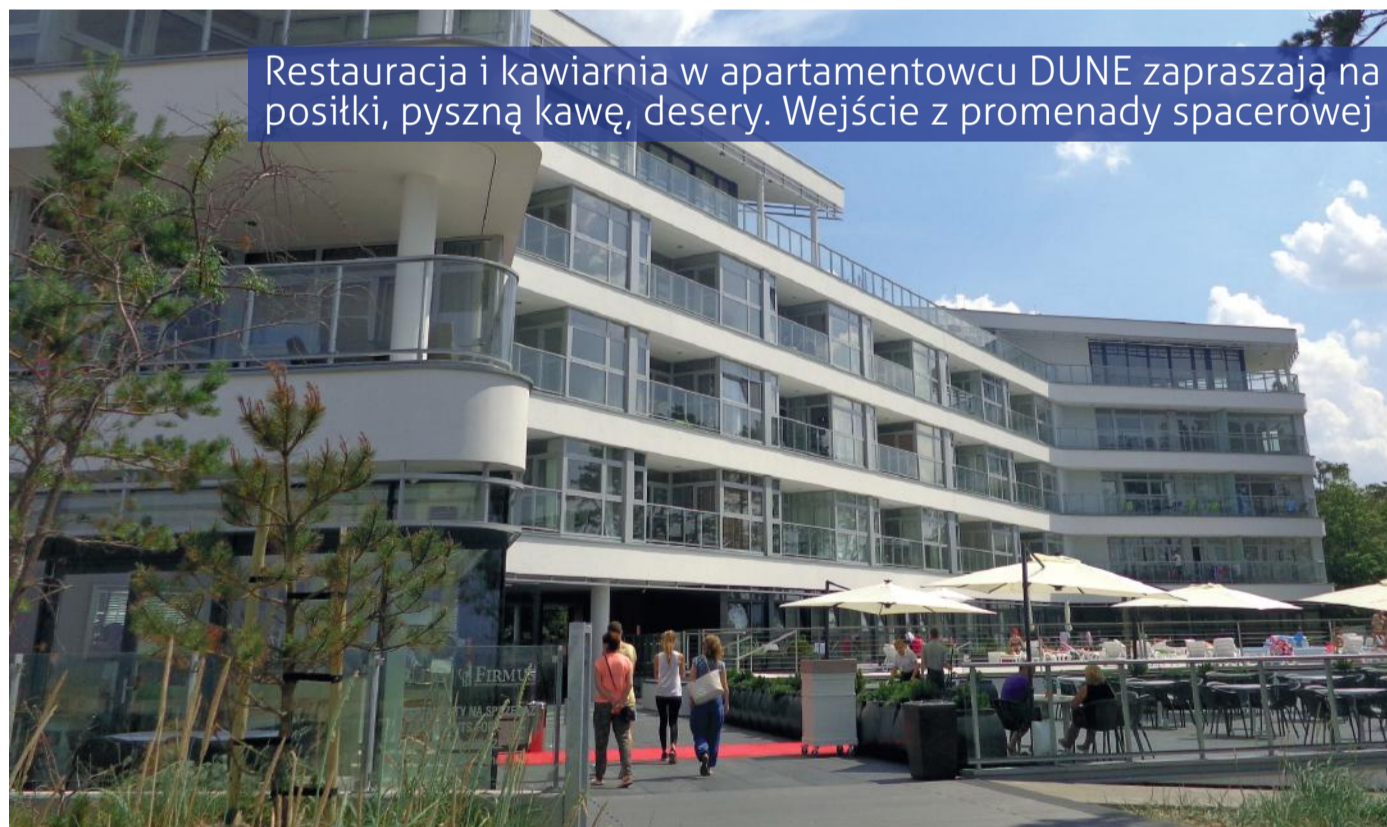
Restauracja i kawiarnia w apartamentowcu DUNE zapraszają na posilki, pyszną kawę, desery. Wejście z promenady spacerowej