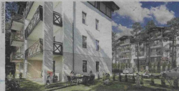
W Mielnie rośnie Rezydencja Park Rodzinna

Jakie znajdują się tu udogodnienia dla rodzin? Po pierwsze, zamiast recepcji zaplanowano przytulne lobby z ciepłych kolorach z kąciakiem zabaw oraz sofą i pufami. Na zewnątrz dzieci będą mogły korzystać z dużego placu zabaw z dużą liczbą kolorowych urządzeń. W pobliżu znajdzie się miejsce, gdzie rodzice będą mogli przysiąść i obserwować bawiące się maluchy. Apar-